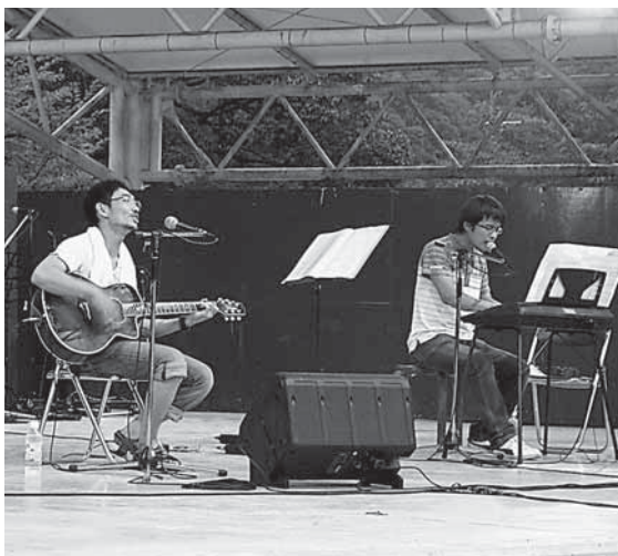
地元バンド フォレストアース

また、会場入り口に設営された燈火会のほのかな灯りが、会場に向かう人々を和ませていました。