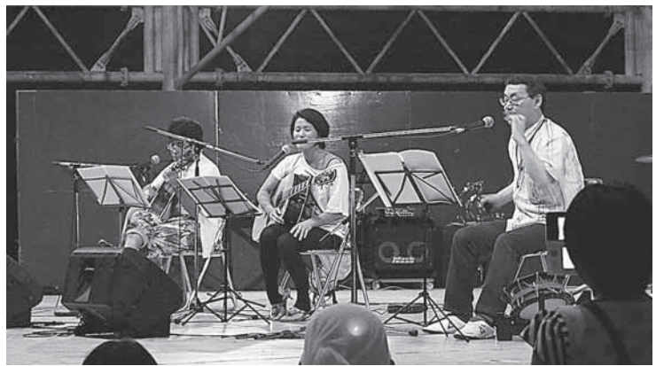
ヒット・オア・ミス の演奏