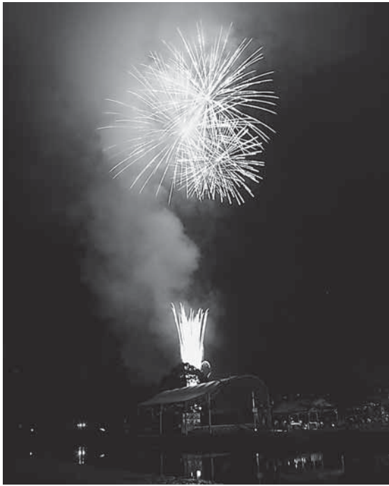
迫力ある打ち上げ花火