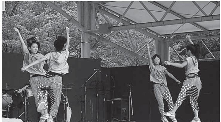
練習の成果を披露するキッズダンス