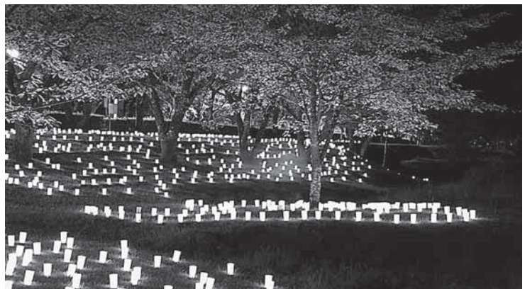
燈火会が道行く人を和ませます