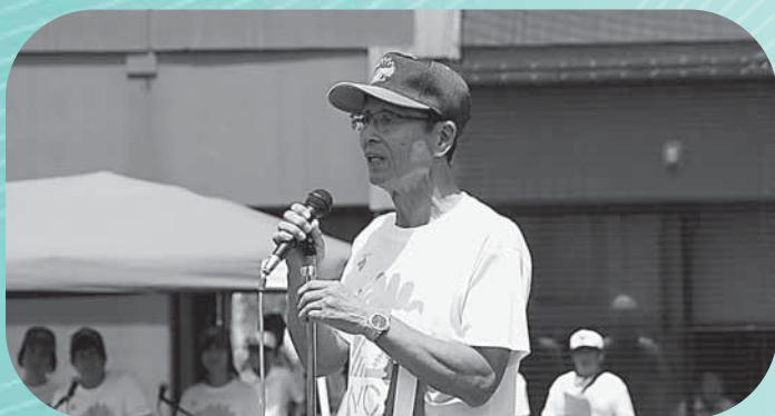
開会式であいさつをする王貞治氏 (くまのスタジアムにて)